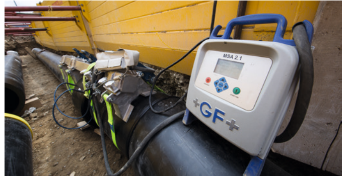
Installation der Komponenten vor Ort bei der Max Schetter AG.

Eine patentierte Technologie, die aktive Armierung, sorgt bei den Rohren für eine langanhaltende und sichere Verbindung. Dazu wird schon bei der Herstellung der Armierungsring mit hohen Kräften über den Innenring gepresst. Während des Schweissprozesses verringert die Wärme die Steifigkeit des inneren Rings, der Armierungsring drückt von aussen. So können grössere Spalten schneller und sicher geschlossen werden.